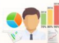
กลุ่มผู้บริหาร

ระบบบริหารงานวิชาการของสถานศึกษา ที่มุ่งไปให้ถึงการเชื่อมโยงกับกรอบทิศทางการพัฒนาประเทศด้าน การอาชีวศึกษาทั้งในปัจจุบัน และระยะยาวอย่างมีประสิทธิภาพ