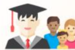
กลุ่มนักเรียนนักศึกษา/ผู้ปกครอง