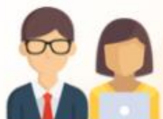
กลุ่มครูและครูที่ปรึกษา