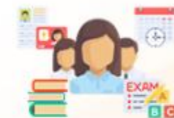
กลุ่มบุคลากร/เจ้าหน้าที่